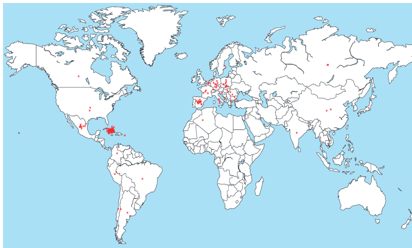
Figura 2. Mapa geográfico de la participación institucional por países en los catálogos de exposiciones

El análisis de los catálogos del MNBA revela una fuerte presencia de instituciones clave tanto nacionales como extranjeras en el desarrollo de sus exposiciones. A nivel local, destacan el Consejo Nacional de Cultura (CNC) y el Museo Nacional de Bellas Artes (MNBA), junto con otras entidades culturales cubanas que conforman una red institucional sólida. En el plano internacional, sobresalen alianzas con instituciones de España, por ejemplo, la Agencia Española de Cooperación Internacional para el Desarrollo (AECID), la Fundación Cultura Mapfre Vida y la Embajada de España; de Alemania, el Ludwig Forum für Internationale Kunst y la Fundación Ludwig de Cuba; Polonia destaca con la participación del museo Centralne Biuro Wystaw Artystycznych (CBWA); de América Latina resalta la presencia del Museo Universitario de Ciencias y Artes (MUCA), de Ciudad de México, y el Instituto Nacional de Cultura del Perú (INC); así como de organismos multilaterales, como la Unesco. Lo anterior, confirma el carácter global y colaborativo de la programación expositiva del museo.