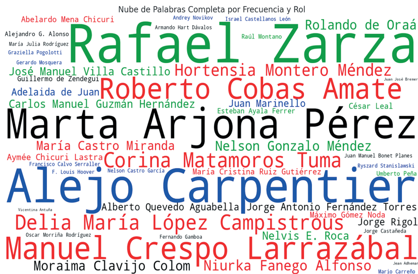
Figura 4. Nube de palabras con la frecuencia de directivos, críticos, educadores, artistas, curadores y diseñadores participantes en los catálogos de exposiciones del MNBA de Cuba

Visualmente, se observa una mayor concentración de nombres en rojo, lo que sugiere una representación particularmente amplia de curadores en el conjunto analizado.