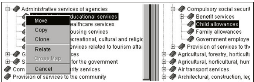
Muestra del módulo de creación y gestión de taxonomías de Wordmap Taxonomy Management System.