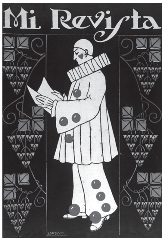
Figura 3. Portada de Mi Revista, 1919.