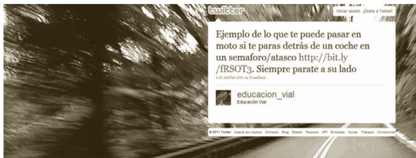
Imagen 6: Uso de twitter dentro de un programa formativo sobre Educación Vial.

A medias entre el software social y los blogs se halla el concepto de microblogging puesto de moda por twitter . Es un servicio gratuito para el envío de mensajes de texto (“tweets”) con longitud máxima de 140 caracteres y que pueden ser publicadas tanto en la cuenta del usuario en twitter como en otros servicios sociales al mismo tiempo que se permite su reenvío vía SMS o correo electrónico.